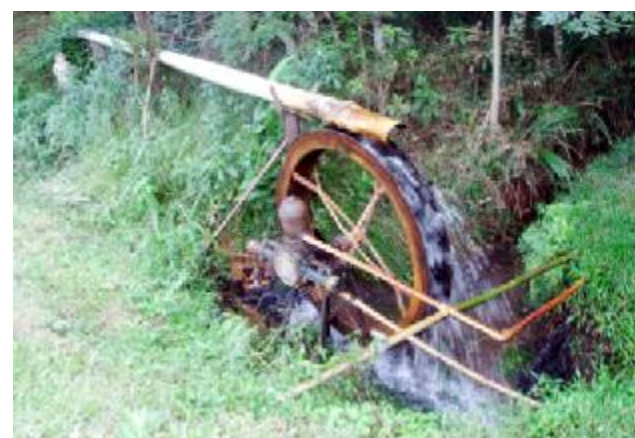
Energia hídrica com roda d'água