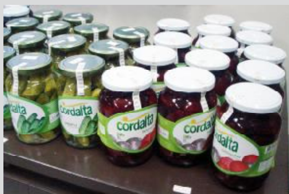
Detalhe da produção de conservas do município

Cordilheira Alta encontra-se numa área de 83.768 Km 2 , com altitude de 768 m e uma população de 3.493 habitantes. Está cercada por cordilheiras, o que acabou originando o nome da cidade a qual foi fundada em 30 de março de 1992. Tem a sua economia baseada na agricultura, suinocultura, avicultura e no comércio. Um dos espaços de comercialização de produtos coloniais e artesanais é o stand no Mercado Público Regional, onde é possível encontrar diversos tipos de vinhos, cachaça, graspa, vinagre, crem, feijões. Os pães são assados sobre palha de milho em forno de barro. É possível encontrar cucas, bolachas, paçoca, rapadura, massas e salgados de vários tipos, congelados, queijos, diversas variedades de doces de frutas e conservas. Os produtos in natura são: noz-pecã, ovos, alho, tomate, abobra, pepino, moranga, tomate, além de vassouras e artesanatos.