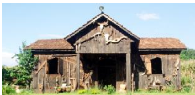
Museu do Tropeiro Velho

O Agroturismo é uma forma de divulgação e intercâmbio de experiências entre as pessoas do meio rural e urbano. Esse processo ocorre em propriedades rurais que proporcionam bem estar aos que busca prazer, aventura, descanso e novos conhecimentos, e geração de trabalho e renda para as famílias de agricultores.