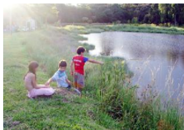
Açude anti stress