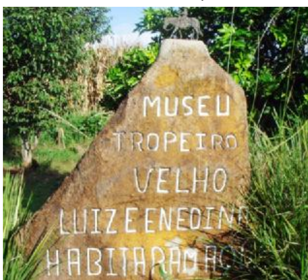
Escultura em pedra do artista Cyro Sosnoski