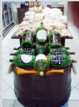
Um dos pontos fortes – comercialização de vinho

Cordilheira Alta encontra-se numa área de 83.768 Km 2 , com altitude de 768 m e uma população de 3.493 habitantes. Está cercada por cordilheiras, o que acabou originando o nome da cidade a qual foi fundada em 30 de março de 1992. Tem a sua economia baseada na agricultura, suinocultura, avicultura e no comércio. Um dos espaços de comercialização de produtos coloniais e artesanais é o stand no Mercado Público Regional, onde é possível encontrar diversos tipos de vinhos, cachaça, graspa, vinagre, crem, feijões. Os pães são assados sobre palha de milho em forno de barro. É possível encontrar cucas, bolachas, paçoca, rapadura, massas e salgados de vários tipos, congelados, queijos, diversas variedades de doces de frutas e conservas. Os produtos in natura são: noz-pecã, ovos, alho, tomate, abobra, pepino, moranga, tomate, além de vassouras e artesanatos.