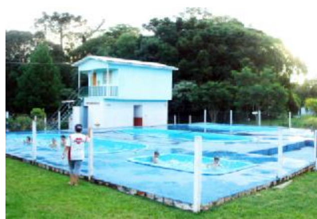
Opção – banho de piscina