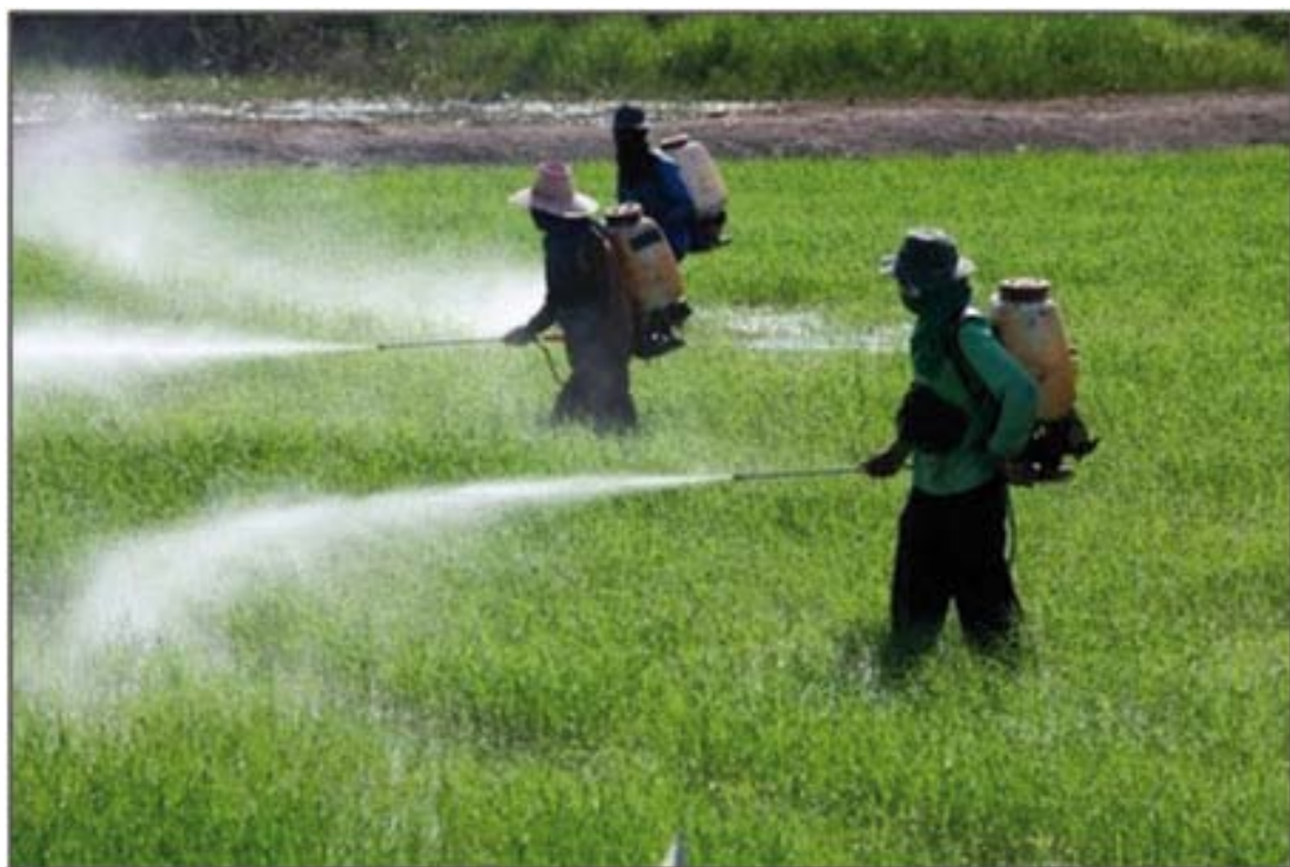
Agricultores aplicando agrotóxicos em plantação.

• Touca árabe: protege a cabeça e o pescoço da névoa tóxica no momento da aplicação do agrotóxico.