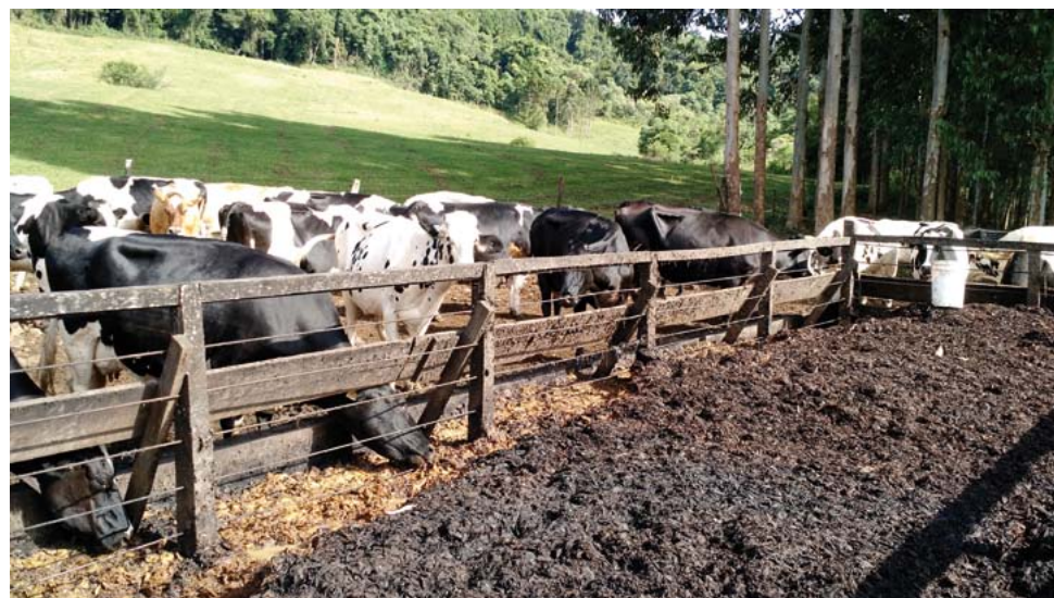
Resíduos da indústria de processamento de banana utilizados na alimentação de vacas leiteiras.

Em estudo realizado no meio oeste catarinense, buscando atender uma necessidade dos produtores de leite desta região, os quais utilizam a casca de banana in natura gerada por uma indústria local, como fonte de nutrientes para a nutrição das vacas, foi constatada que a inclusão deste resíduo em até 54% da matéria