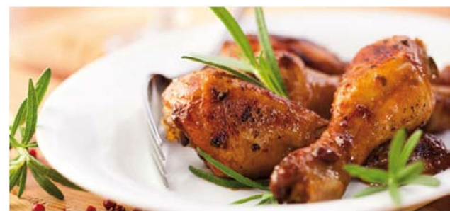
Segurança alimentar – garantia de qualidade do campo até a casa do consumidor!

A ausência da Salmonella nestes produtos