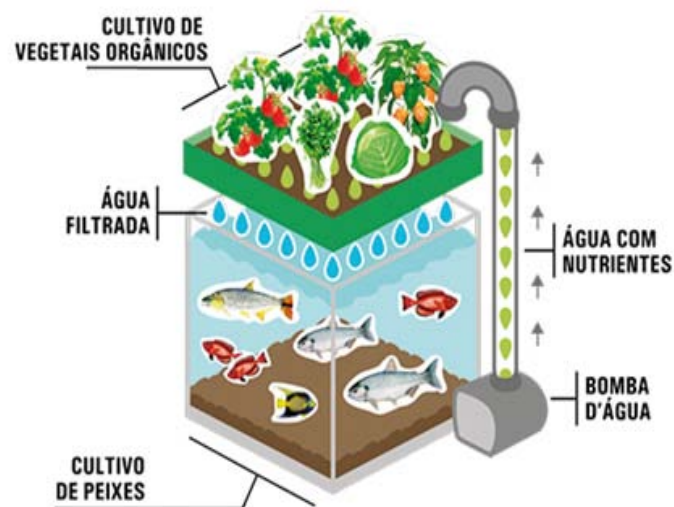
ilustração: Vicente Henrique