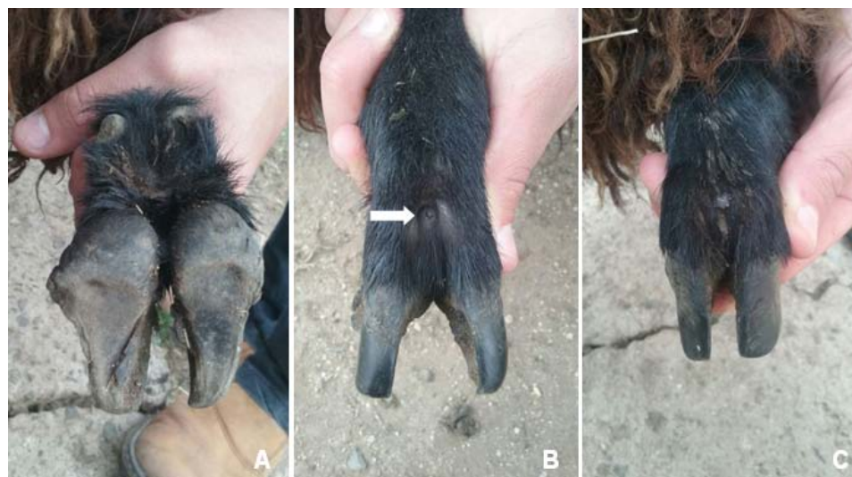
Figura 1. Carneiro de quatro dentes da raça Crioula Lanada, vista palmar da porção distal do membro (A). Vista dorsal, notar orifício da glândula interdigital obstruída por sujidades e pelos (seta) (B). Aspecto após limpeza e compressão da glândula, líquido untuoso acumulado (C).

• “Laminite” é um processo inflamatório das estruturas sensíveis da parede dos cascos, tendo menor ocorrência, sendo a principal causa a acidose ruminal. Esta é decorrente da ingestão excessiva de grãos, levando a um aumento na produção de ácido lático no rúmen, causando a morte de grande número de bactéria e liberação de suas toxinas. A acidose provoca uma lesão na mucosa ruminal (revestimento interno)