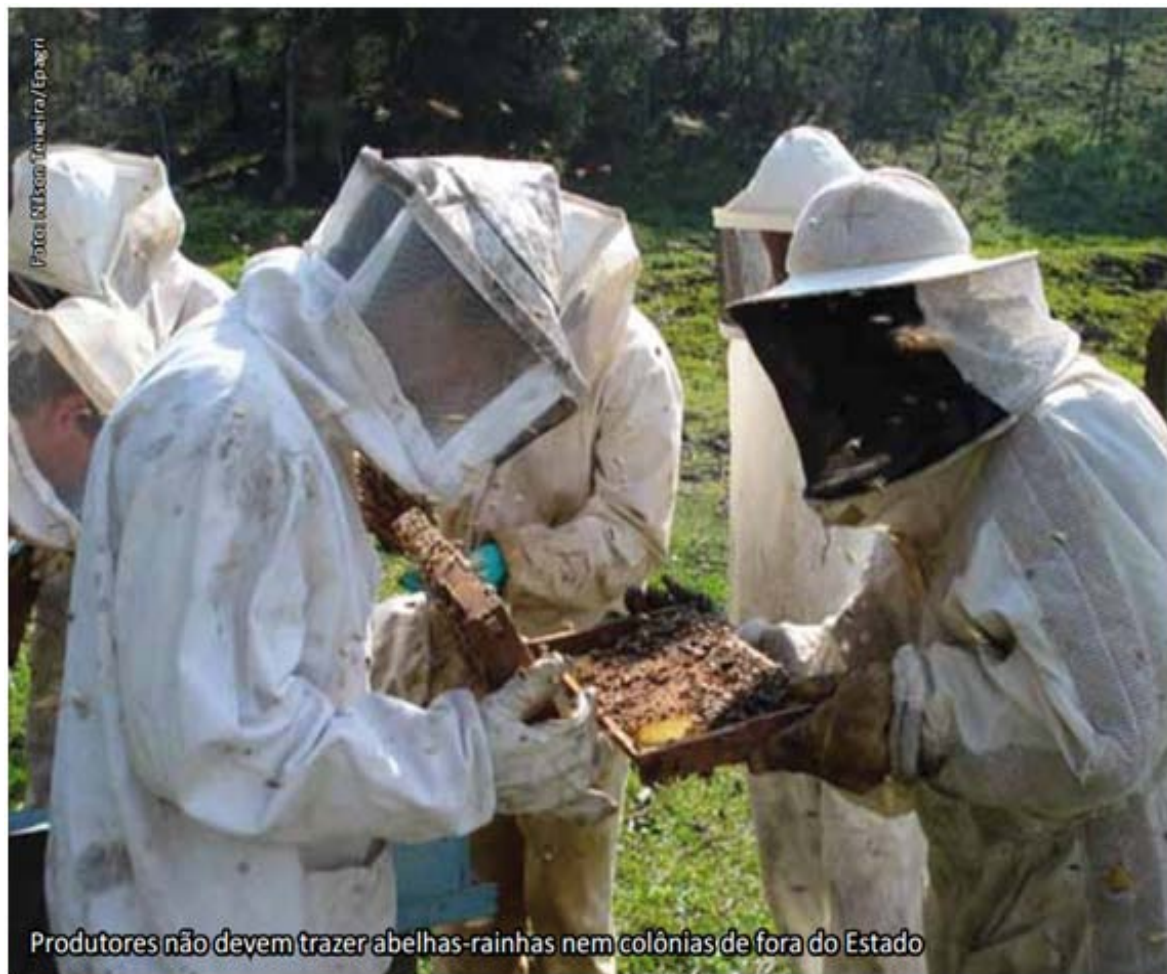
Produtores não devem trazer abelhas-rainhas nem colônias de fora do Estado