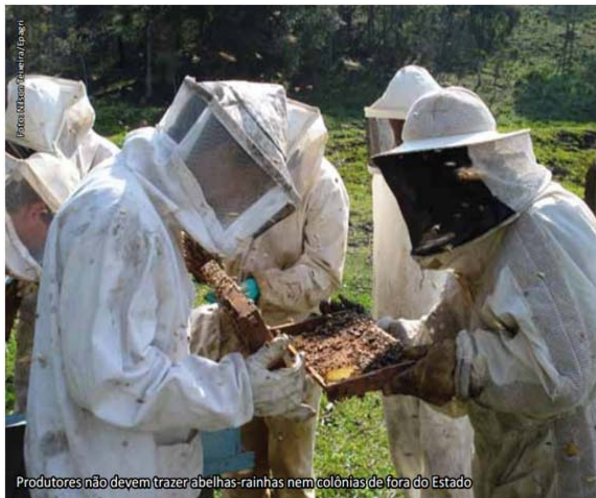
Produtores não devem trazer abelhas-rainhas nem colônias de fora do Estado